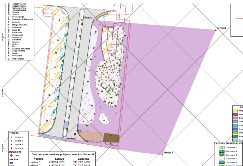
Gráfica 1: Vista general de la ubicación del intercambiador vial en la intersección de la avenida Medellín (calle 80) con avenida las quintas (CARRERA 119) y la carrera 120 en Bogotá D.C.

CONSTRUCCIÓN DEL INTERCAMBIADOR VIAL EN LA INTERSECCIÓN DE LA AVENIDA MEDELLÍN (CALLE 80) CON AVENIDA LAS QUINTAS (CARRERA 119) Y LA CARRERA 120 EN BOGOTÁ D.C.”